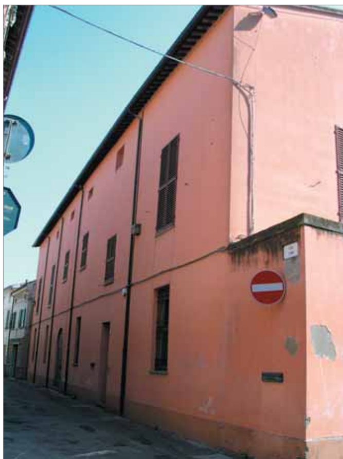
Via Forni 2; 2a Fronte Principale