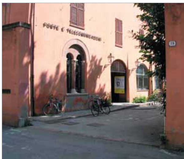
Via Fiume 19 Fronte Laterale